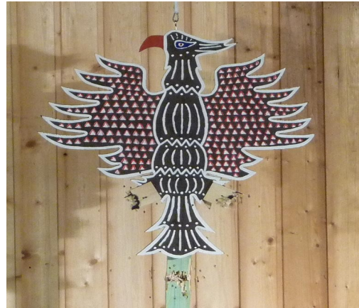
und so am Ende!